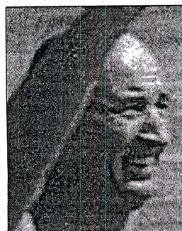
Angier Biddle Duke.

que aquellos con verdadera influencia tenderían probablemente a hacer lo indicado, es decir, llamar a don Juan al trono. Juan Carlos comentó que eso sería muy malo para el país. Su padre, dijo, estaba demasiado alejado de la realidad política española para captar realmente lo que estaba pasando. Dijo que mi evaluación podría ser correcta respecto a la probable inclinación de los líderes del Gobierno en el momento de la decisión pero, preguntó, ¿qué sucedería en las Cortes? Dijo que no estaba en absoluto seguro de que las Cortes estuvieran dispuestas a aceptar a su padre en el trono. Y reiteró este punto diciendo que