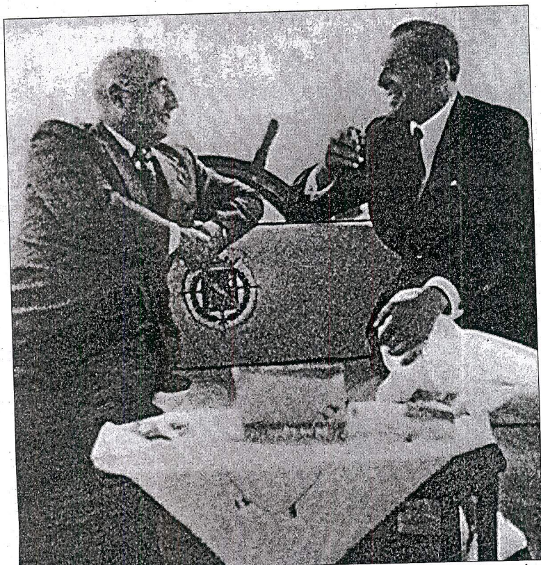
Entrevista entre Franco y don Juan de Borbón a bordo del Azor, en agosto de 1948, para discutir la conveniencia de que don Juan Carlos se eduque en España.